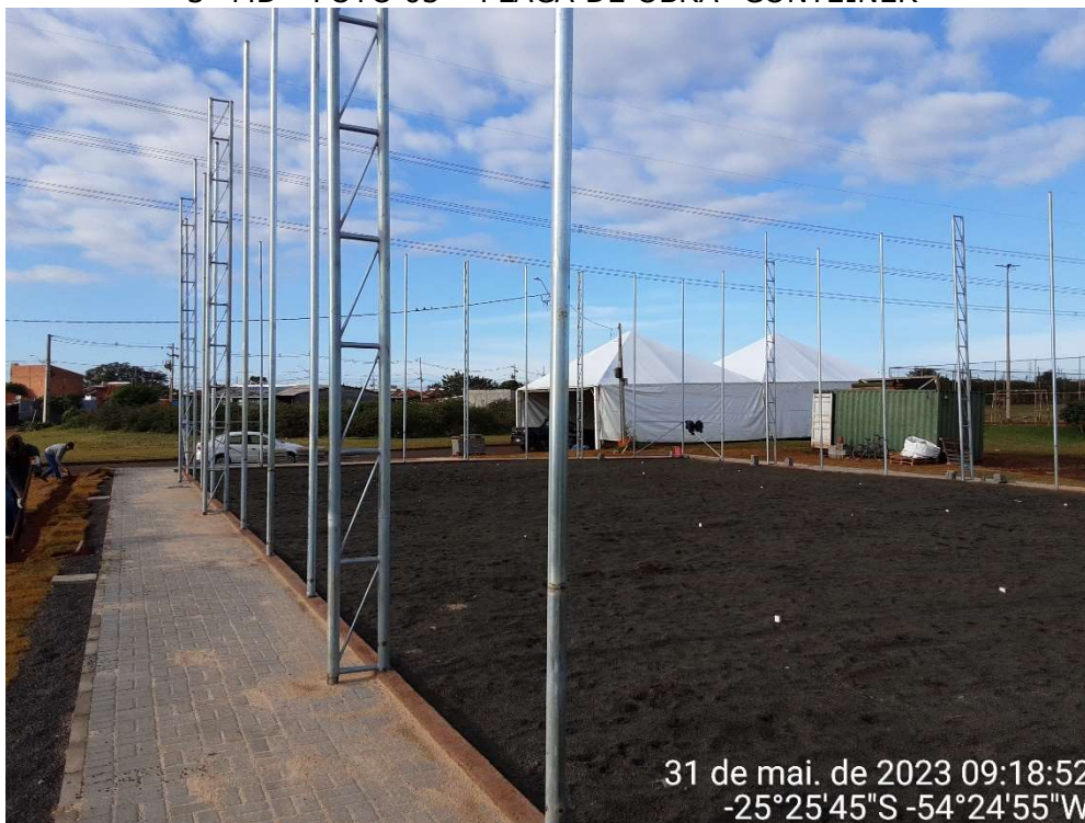
3ª MD - FOTO 03 – PLACA DE OBRA- CONTEINER

31 de mai. de 2023 09:18:52 -25°25'45"S -54°24'55"W