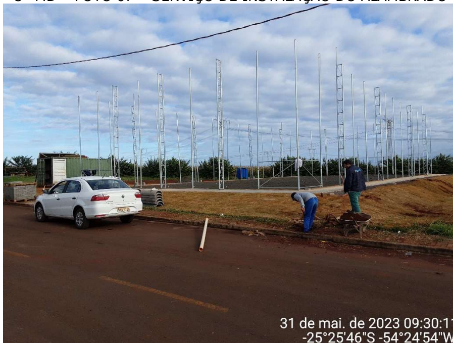
3ª MD – FOTO 07 – SERVIÇO DE INSTALAÇÃO DO ALAMBRADO

31 de mai. de 2023 09:30:11 -25°25'46"S -54°24'54"W