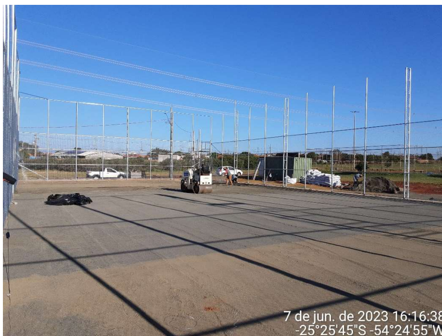
3ª MD - FOTO 05 - SERVIÇO DE INSTALAÇÃO DO SISTEMA DE DRENAGEM

7 de jun. de 2023 16:16:38 -25°25'45"S -54°24'55"W