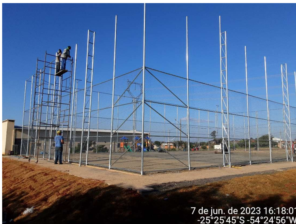
3ª MD – FOTO 11 – INSTAÇÃO POSTE PADRÃO E TELAS ALAMBRADO

7 de jun. de 2023 16:18:01 -25°25'45"S -54°24'56"W