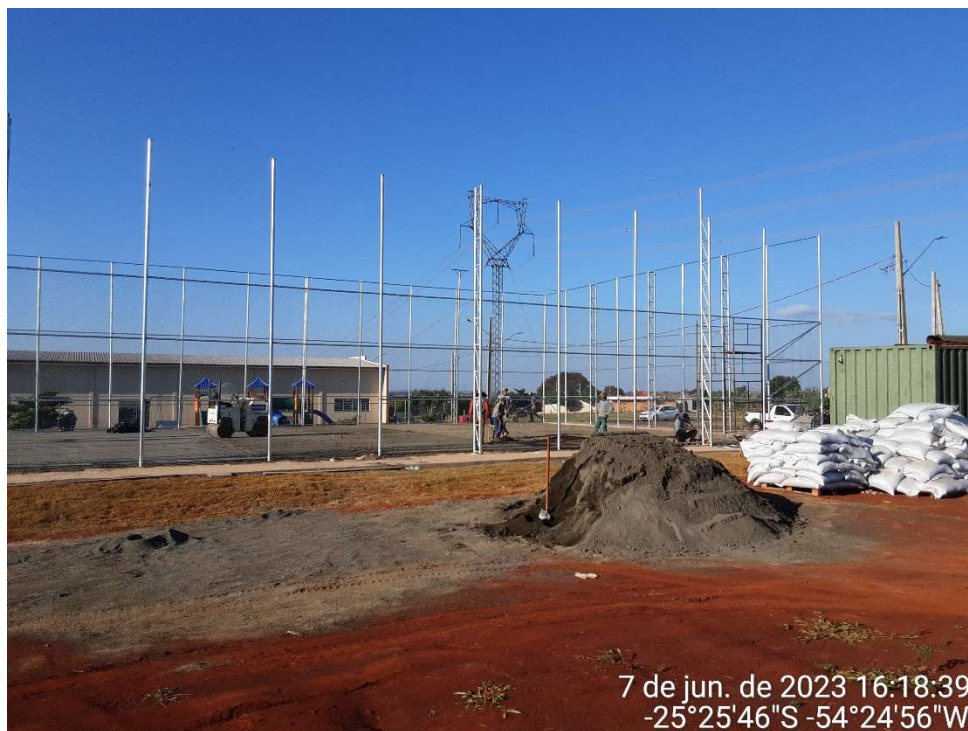
3ª MD – FOTO 10 – PEDRISCO BASE E BORRACHA PARA GRAMA