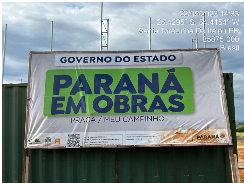
3ª MD - FOTO 01 - PLACA DE OBRA