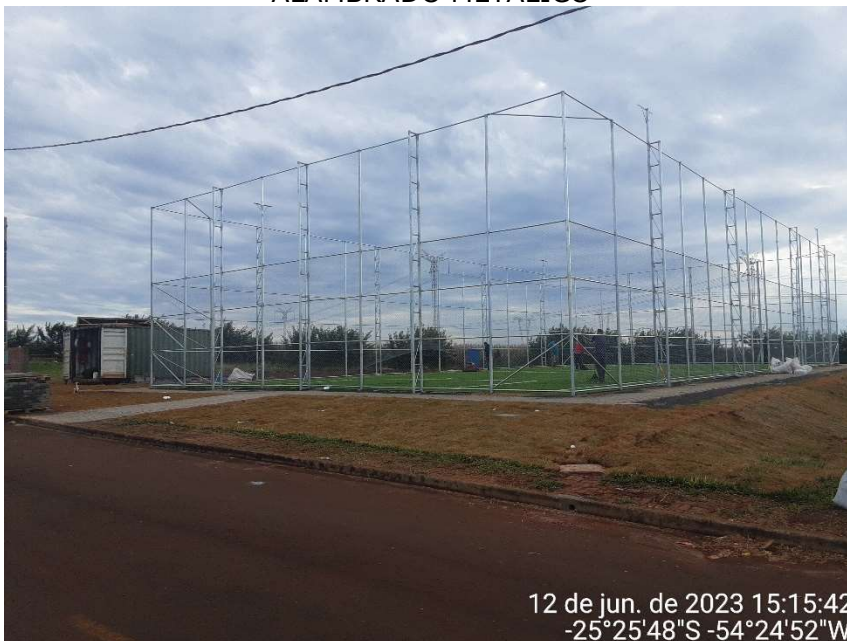
3ª MD – FOTO 13 – SERVIÇO DE INSTALAÇÃO DA TELA GALVANIZADA DO ALAMBRADO METÁLICO

12 de jun. de 2023 15:15:42 -25°25'48"S -54°24'52"W