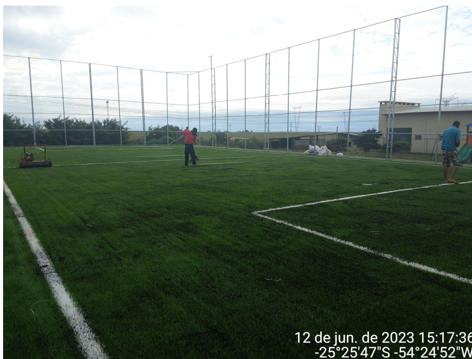
3ª MD – FOTO 15 – SERVIÇO DE CONCLUSÃO INSTALAÇÃO D GRAMA SINTÉTICA

12 de jun. de 2023 15:17:36 -25°25'47"S -54°24'52"W