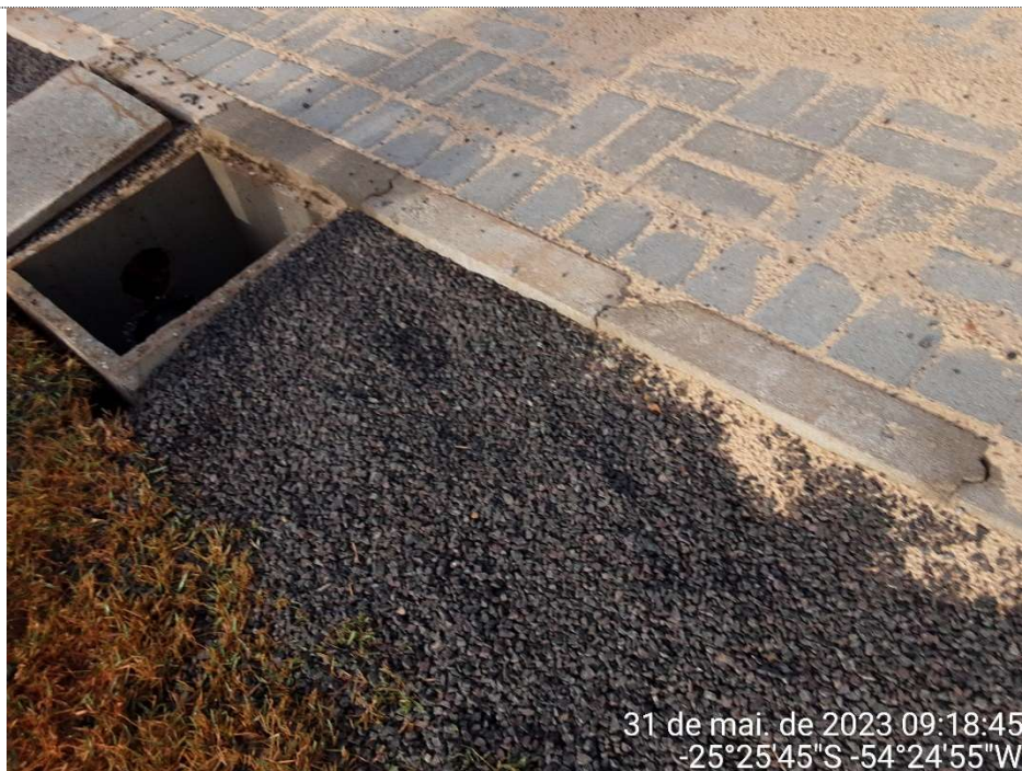
3ª MD – FOTO 09 – CAIXAS DE DRENAGEM- PAVIMENTAÇÃO PAVER