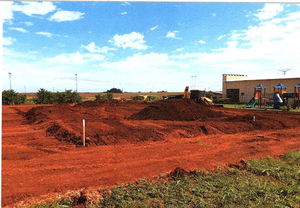
1ª MD - FOTO 01 – MOVIMENTAÇÃO DE TERRA PARA O REATERRO