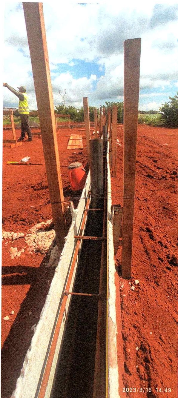
1ª MD - FOTO 13 - DETALHE DA MONTAGEM DA CAIXARIA, FERRAGEM E TUBOS METÁLICOS PARA SUSTENTAÇÃO DA TELA DE FECHAMENTO