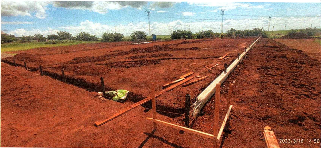
1ª MD - FOTO 10 – REMOÇÃO PARCIAL DA CAIXARIA