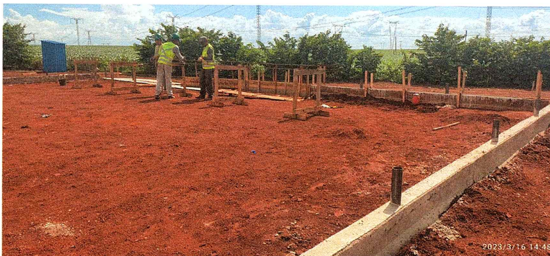
1ª MD - FOTO 15 – FUNCIONÁRIOS DA EMPRESA TRABALHANDO NA COMFEÇÃO DAS FERRAGENS