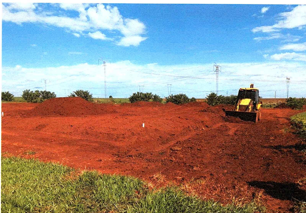
1ª MD - FOTO 02 – MOVIMENTAÇÃO DE TERRA EM TORNO DO REATERRO