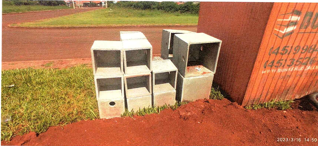
1ª MD - FOTO 11 – CAIXAS DE PASSAGEM