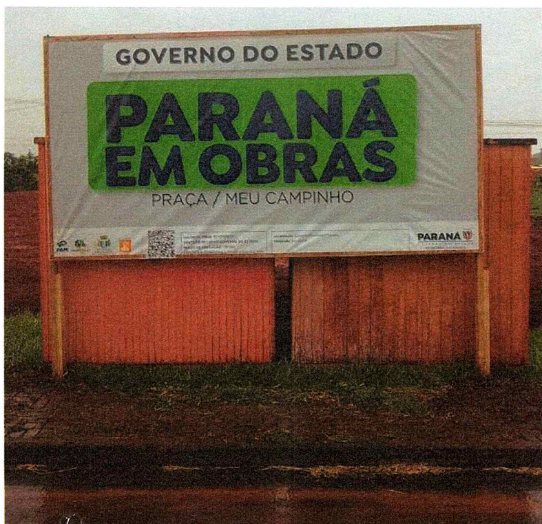
1ª MD - FOTO 04 – PLACA DE OBRA E BARRACÃO DE OBRA