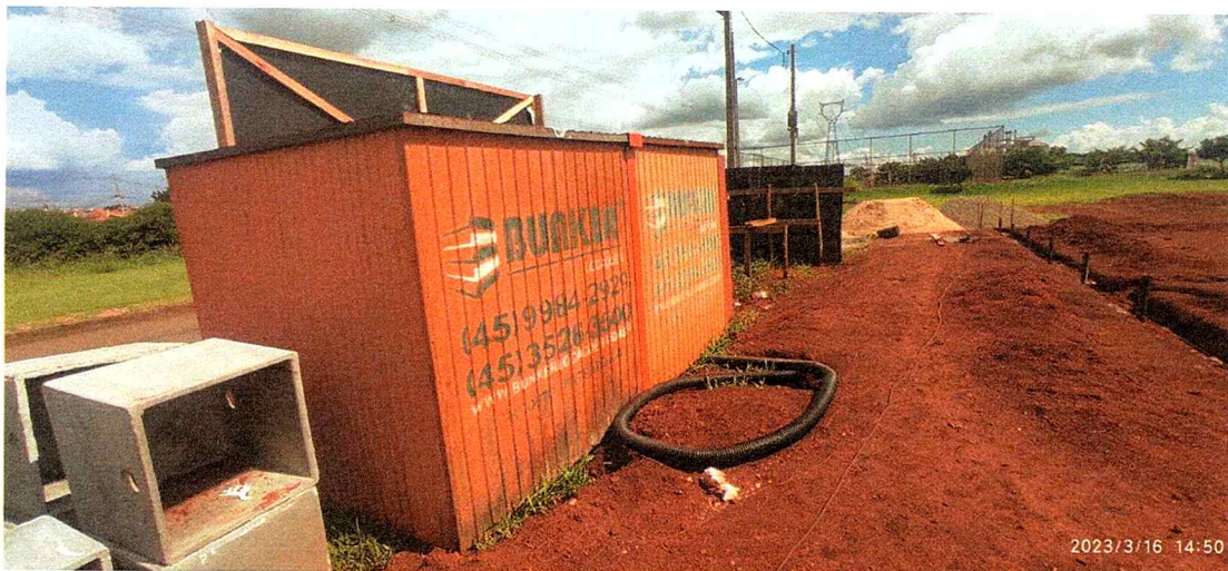
1ª MD - FOTO 12 – DETALHE DO BARRACÃO DE OBRA E MATERIAIS CONSTRUTIVOS