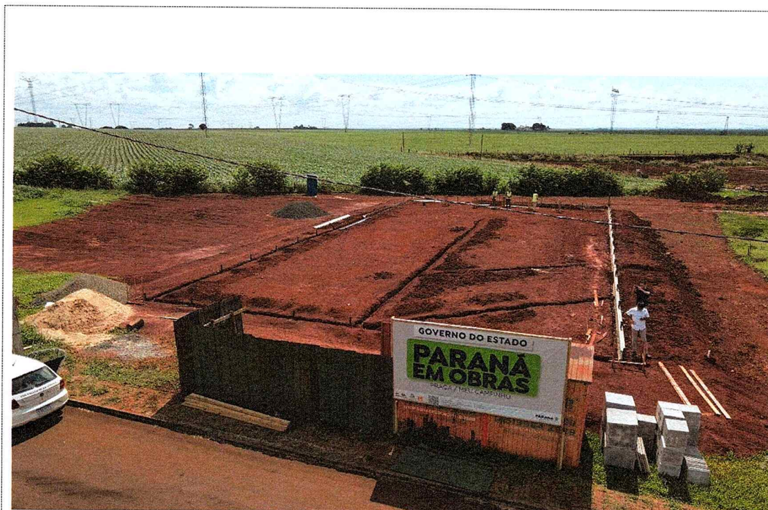
1ª MD - FOTO 05 – INICIO DO FECHAMENTO COM TAPUME E VALAS DE DRENAGEM