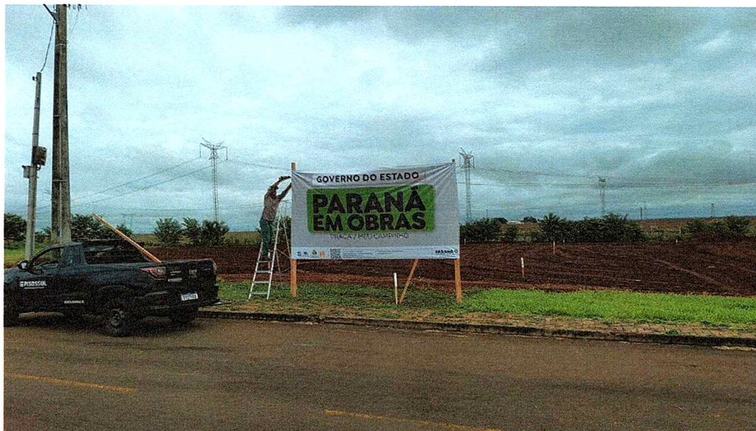
1ª MD - FOTO 03 – SERVIÇO DE INSTALAÇÃO DA PLACA DE OBRA, ESTACAS DE LOCAÇÃO DO CAMPO