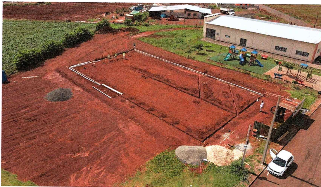
1ª MD - FOTO 07 - IMAGEM AÉREA DA LOCAÇÃO DA OBRA EM RELAÇÃO AO ENTORNO, ÂNGULO 1