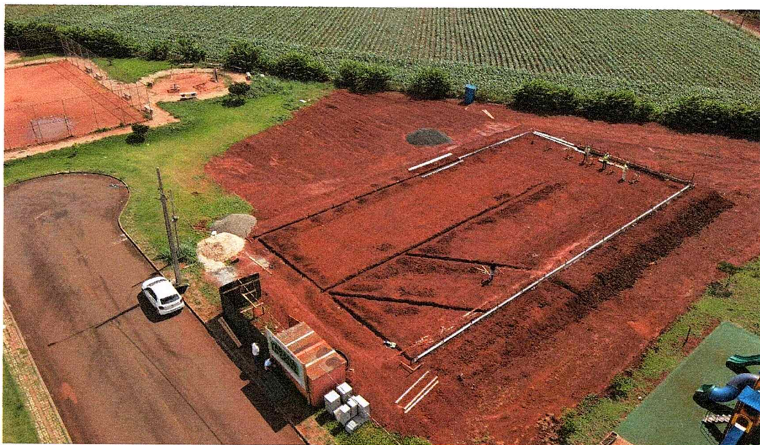
1ª MD - FOTO 08 - IMAGEM AÉREA DA LOCAÇÃO DA OBRA EM RELAÇÃO AO ENTORNO, ÂNGULO 2