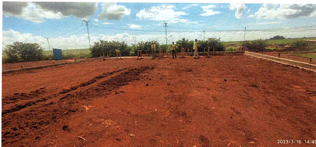
1ª MD - FOTO 14 – FUNCIONÁRIOS DA EMPRESA TRABALHANDO